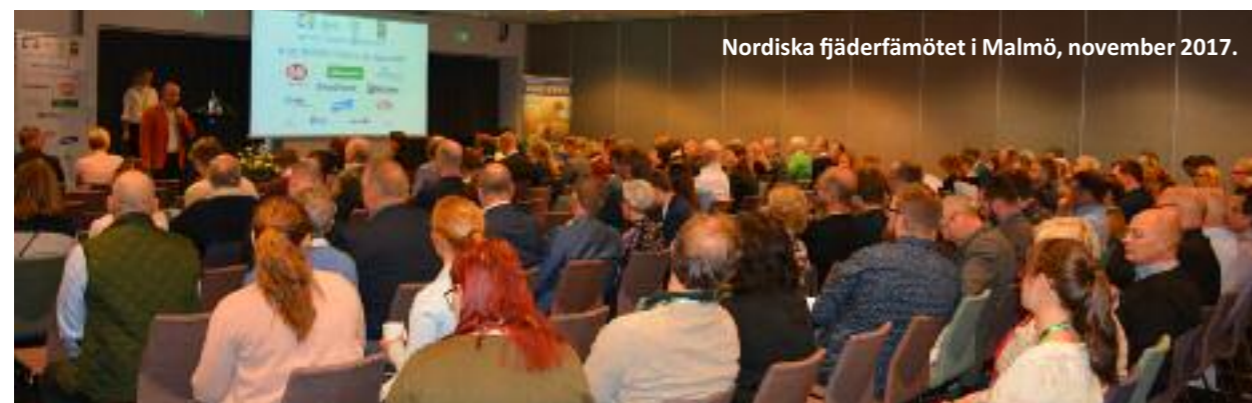
Nordiska fjäderfämötet i Malmö, november 2017.

Årets två nordiska ledarmöten har hållits i Sverige. Rutinen är sådan att det landet som är ansvarig för konferensen, också håller i ledarmötena under samma år. Gruppen möttes de sista dagarna i maj på Styrso utanför Göteborg, samt i Malmö dagen innan fjäderfäkonferensen. På dessa möten har alla på kansliet samt ordförande deltagit, och förutom att planera konferensen har gemensamma problem diskuterats och erfarenheter delats. Övriga nordiska länder genomgår nu motsvarande omställning när det gäller produktionssystem som vi gjorde för några år sedan, där fler och fler butikskedjor slutar att sälja ägg från inredd bur. Island planerar att ha ställt om till flervåningssystem 2021, från konventionella bursystem.