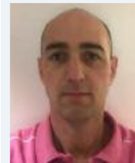
Gustaf Rinman Ekhovs Gård

(Se även styrelsepresentationen på föregående sida).