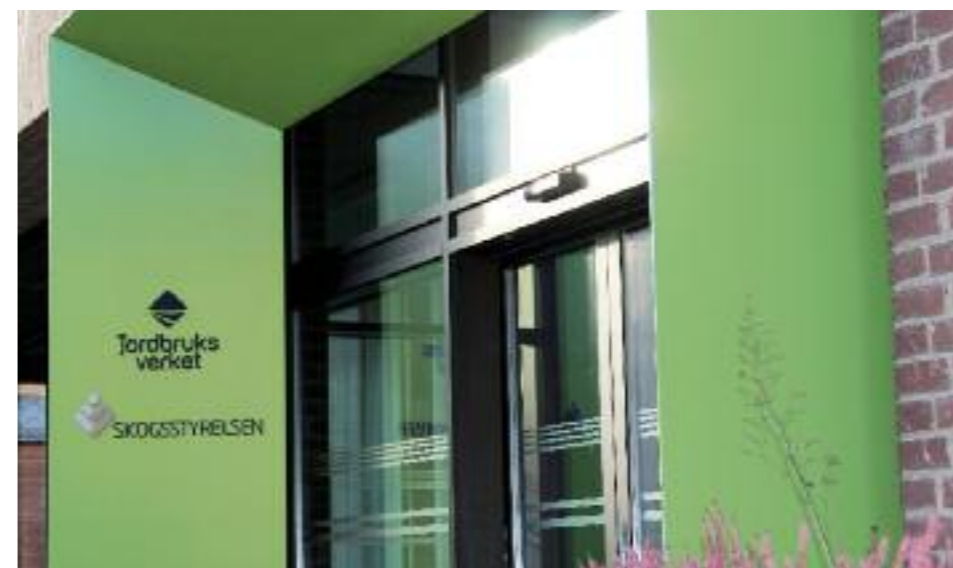
Jordbruksverkets entré i Jönköping.