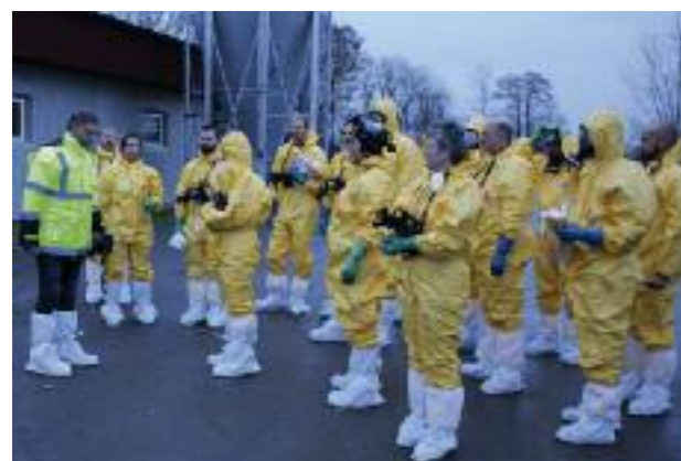
Planering av saneringsarbete vid sjuksomsutbrott.

Vid dessa utbrott uppdagades att Aviär influensa inte täcks av försäkringen. Eftersom Jordbruksverket endast ersätter